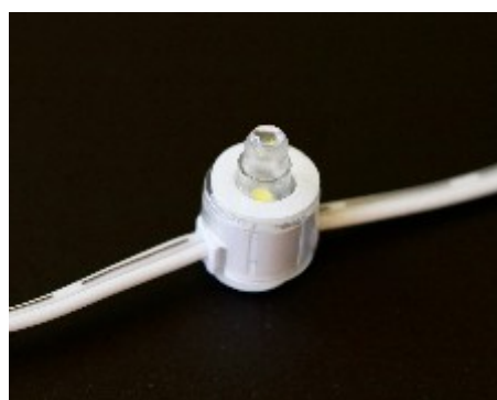
LED-Modul-Kette zur Effektbeleuchtung von Profilbuchstaben